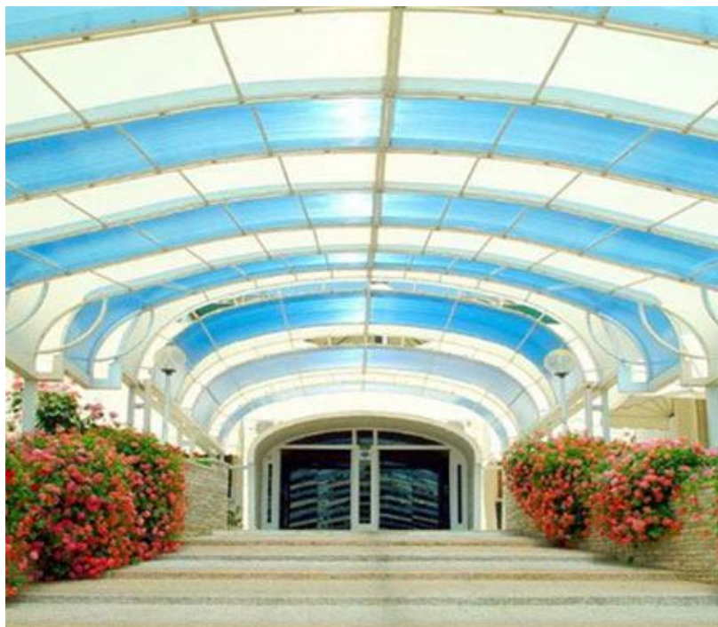
Ingresso del Residence hotel "RACAR" Frigole di Lecce