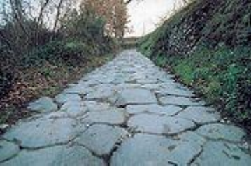
Via Adriana presso Teano

erano affiancate da tre ordini di colonne più piccole.