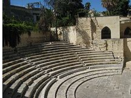
Il Teatro Romano