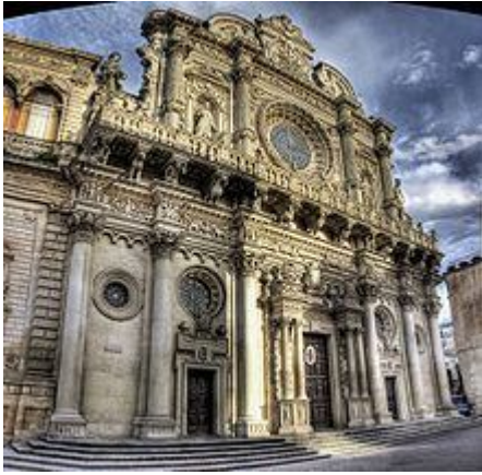
Basilica di Santa Croce

Il centro della città è racchiuso in mura di cinta risalenti al XVI sec., ma ormai in gran parte distrutte. La città presentava originariamente quattro porte di accesso: Arco di Trionfo (Porta Napoli), Porta Rudiae, Porta San Biagio e Porta San Martino. Di queste l'ultima non è più visibile in quanto crollata nel XIX sec.